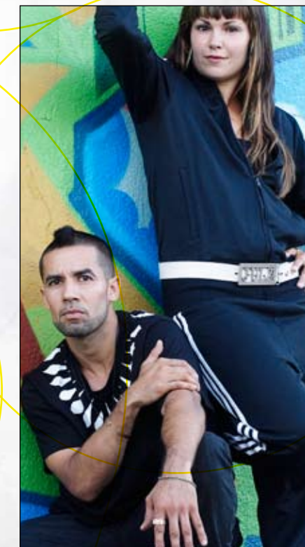
Luv 2 Groove

14h Ouvrir de nouveaux horizons 112 Hall Tabaret, UO