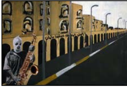
«This is not Haifa Street»