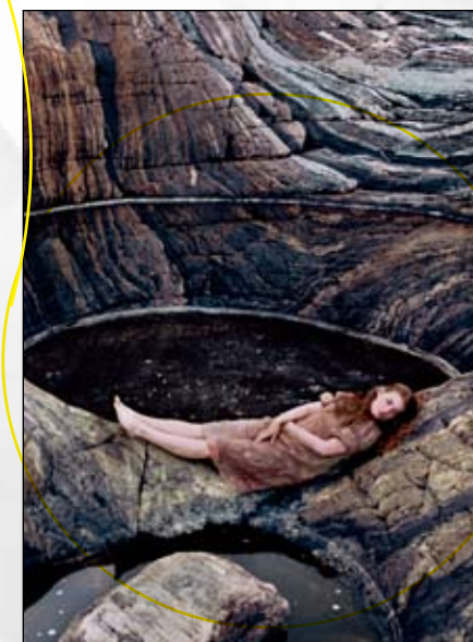
« The Loveliest Girl in the World »